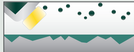
Mit Filajet schutzbehandelt Der Schmutz gleitet ab.